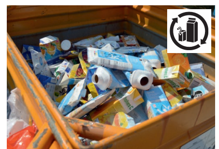
Container für Getränkekartons (Fruchtsäfte, Milch, Saucen, etc.). Container pour les briques à boisson.