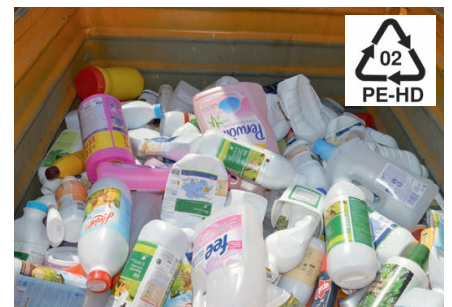
Container für Polyethylen-HD-Produkte (Milchflaschen, Flaschen für Flüssigwaschmittel, etc.). Container pour les produits en polyéthylène HD.