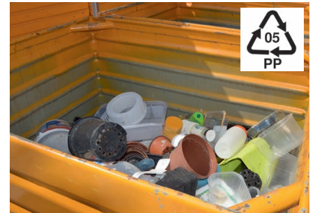
Container für Polypropylen-Produkte (Kanister, Blumentöpfe, etc.) Container pour les produits en polypropylène.

Ces matières plastiques sont recyclées à la voirie de Morat