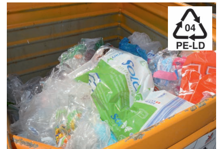
Container für Polyethylen-LD-Folien (Verpackungsfolien, Säcke und Beutel, etc.). Container pour les films en polyéthylène LD.