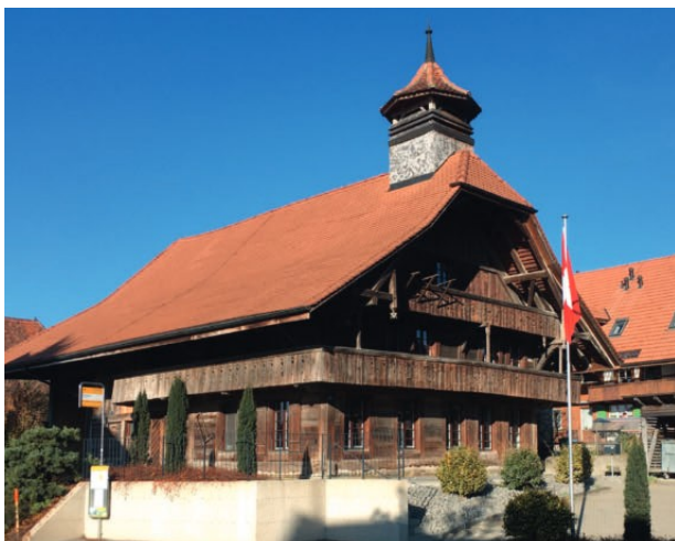
← Altes Schulhaus Salvenach

Viel Vergnügen mit den Schlussworten: Radfahren ist Meditation in Bewegung.